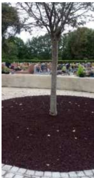
Le Jardin du Souvenir