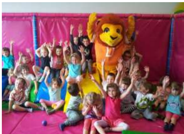
Parc de jeux Djoombaland à Fouesnant