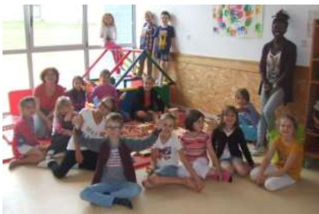
Les enfants au centre de loisirs

Dans le même temps, 47 enfants en moyenne ont fréquenté le centre de loisirs sur les 3 premières semaines des vacances avec un pic les jours de sortie (55 enfants pour les jours de sortie).